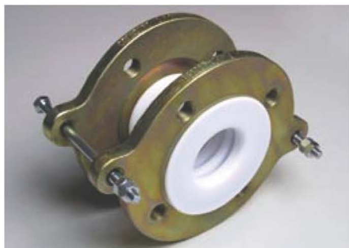
Compensatori in PTFE con anelli di rinforzo/PTFE - expansion joints with reinforcing rings