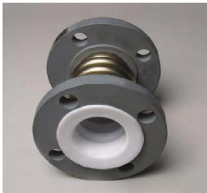
Compensatori di dilatazione in PTFE rivestiti in acciaio inox. PTFE expansion joints with stainless steel cladding.